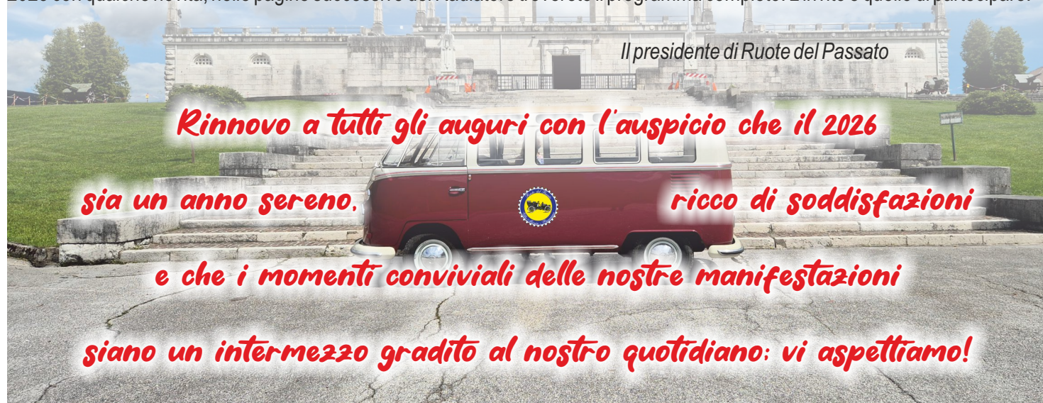
Il presidente di Ruote del Passato

Rinnovo a tutti gli auguri con l'auspicio che il 2026